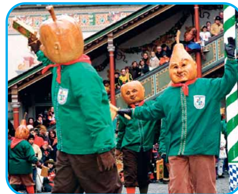
Hoppla Ho: Die Moschköpf tanzen und ratschen.

Schirmherrn Luitpold Prinz von Bayern freute dies. Er erzählte, wie dank des Bieres Bayern katholisch blieb und lud alle Anwesenden zu sich zum König-Ludwig-Bier nach Kaltenberg ein.