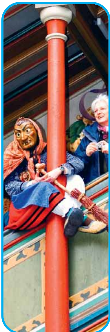
Diese Hexe aus Gengenbach hat einen Logenplatz auf der Rathaustrampe.