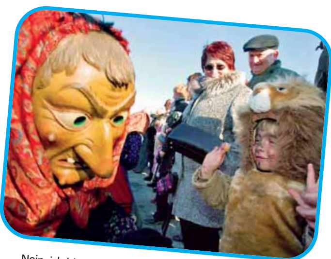
Nein, ich bin kein badischer Löwe, du Geisinger Hexe!