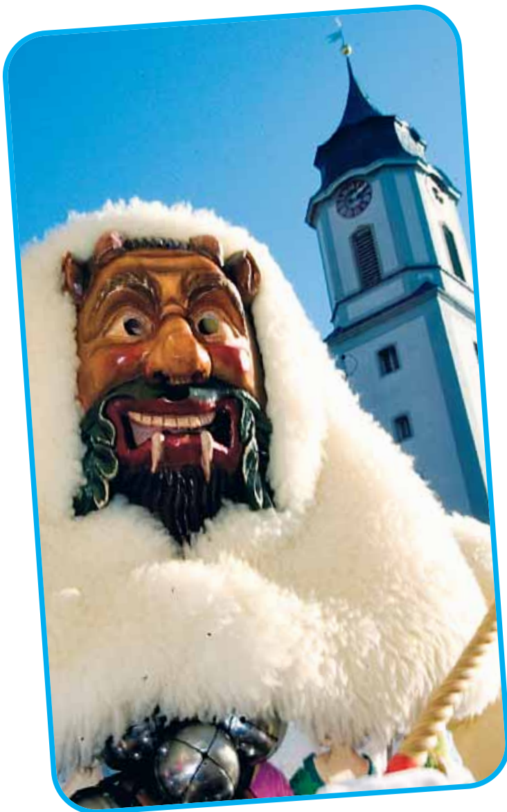
Gar anmutig ist der Narr aus Rottenburg am Neckar.