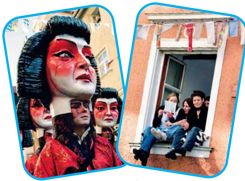
Schweizer Guggemusik... und ihre Fans.