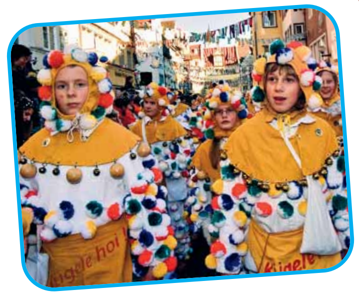
Kügele hoi: Hoi, so viele Kügele haben Ehinger am Häs.