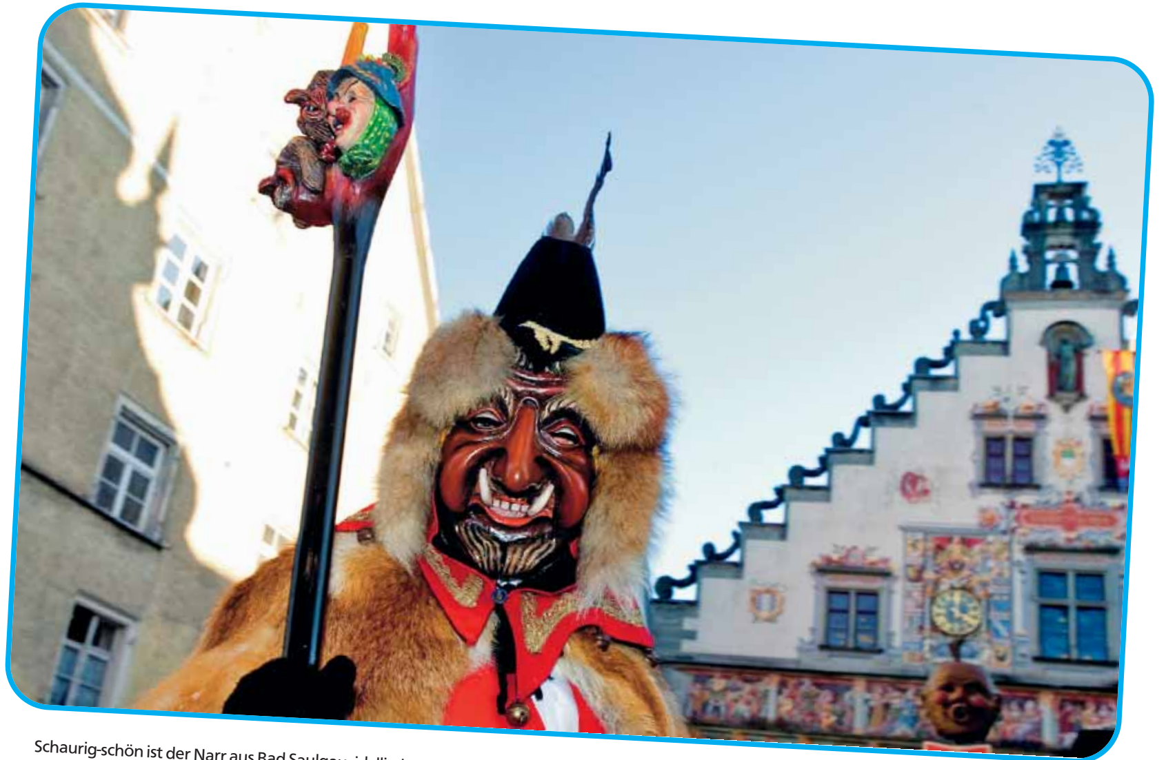
Schaurig-schön ist der Narr aus Bad Saulgau, idyllisch-romantisch das Alte Rathaus in Lindau.