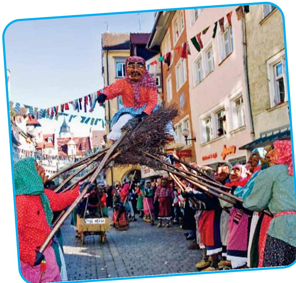
Das Pfullendorfer Hexentor in Lindau.