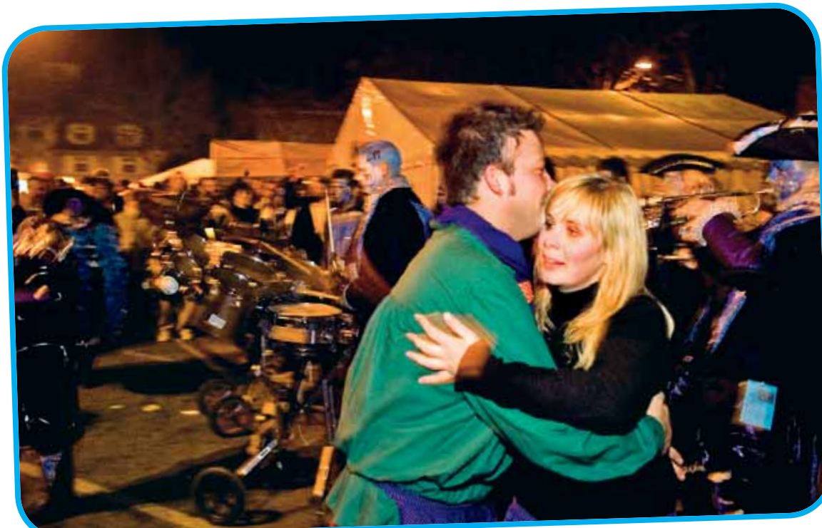
Wenn die Guggemusik spielt, tanzen die Narren gerne närrisch zwischen den Zelten.

Jede Menge Fotos vom großen Umzug des Landschaftstreffens finden Sie im Online-Teil der „Schwäbischen Zeitung“ unter: www.szon.de/news/fotoreportagen