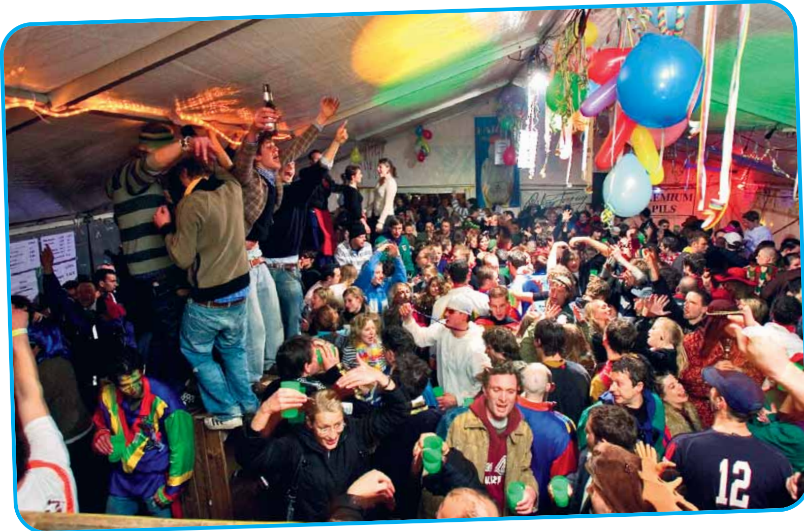
Sie tanzen und singen auf den Tischen in den Zelten; am Boden ist kein Platz mehr.